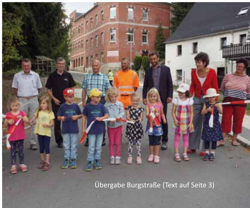
Übergabe Burgstraße (Text auf Seite 3)